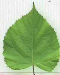
LIPA srdcovité listy