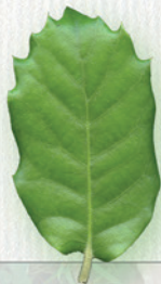
DUB CEZMÍNŤVÝ krátka stopka