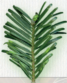
JEDĽA OBROVSKÁ ihlice rastú samostatne