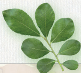
VŘBA RAKYTOVÁ striedavo rastúce listy