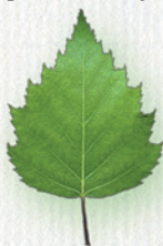
BREZA PREVISNUTÁ pílovité okraje