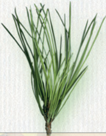
BOROVICA LESNÁ ihlice vo zväzoch