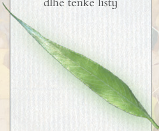
VŘBA BIELA dlhé tenké listy