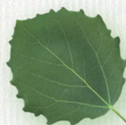
TOPOľ OSIKOVÝ plochá listová stopka