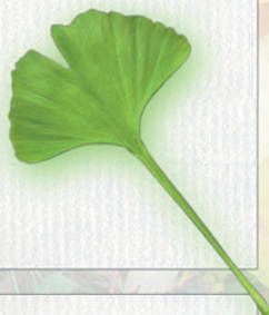
GINKO DVOJLALOČNÉ dlhá listová stopka