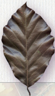
BUK LESNÝ ČERVENÝ jednoduchý list na stopke