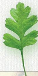
HLOH laločnaté listy