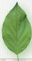
DRIEŇ hladké okraje