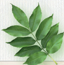
JASEŇ protistoňné listy