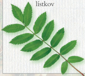
JARABINA Zo stopky vyrastá na rôznych miestach niekoľko lístkov