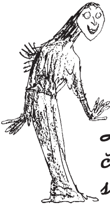
Hlavná čarodejnica sveta